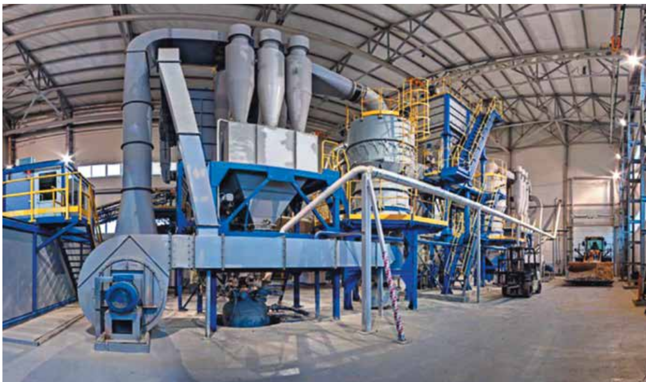
Рис. 2. Измельчительный комплекс КИ для производства минерального порошка

Наибольший эффект может быть получен путем совмещения физико-химической обработки с механическими воздействиями, т.к. при этом активирующий состав наносится в наиболее подходящий момент, когда химическая активность образованных поверхностей максимальна.